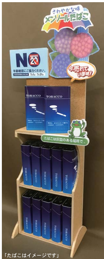
「たばこはイメージです」

DIYの材料として人気のカラーボードをご存知でしょうか。(スチレンボードとも言います)スチロール製なので軽量で扱いやすくリーズナブルな価格! そんなカラーボードを使ったDIYをご紹介します。