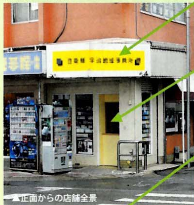
▲正面からの店舗全景

【立地】JRと私鉄を乗り継ぐ、人通りの多い連絡道路に面した角店。 【店主相談】店頭売場を新設したものの、わかりづらいのか? 買いづらいのか? 集客に苦慮。